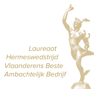
Laureaat Hermeswedstrijd Vlaanderens Beste Ambachtelijk Bedrijf

Noothammetje, hoekhesp of Hagelandse boerenhesp: gerookt in eigen huis op traditionele wijze!